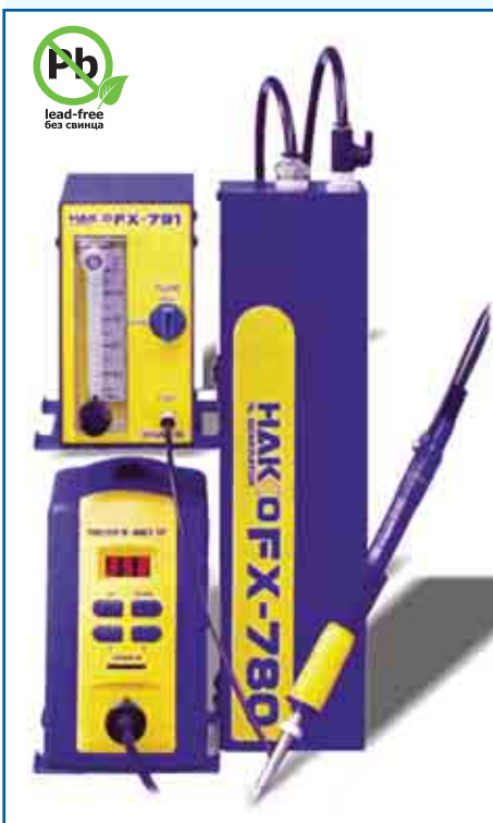
Пример комбинации станции с системой пайки в среде азота